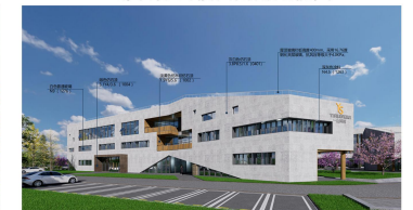
综合办公楼东南角透视图