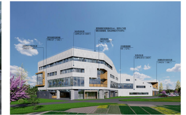
综合办公楼西北角透视图