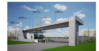
门房东南角透视图