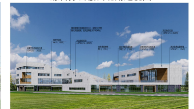
综合办公楼西侧透视图