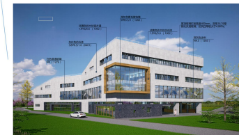
综合办公楼东北角透视图