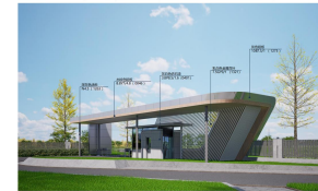
门房西北角透视图