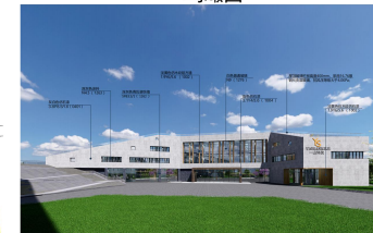
综合办公楼南侧透视图