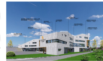
综合办公楼东南角透视图