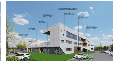
综合办公楼西南角透视图