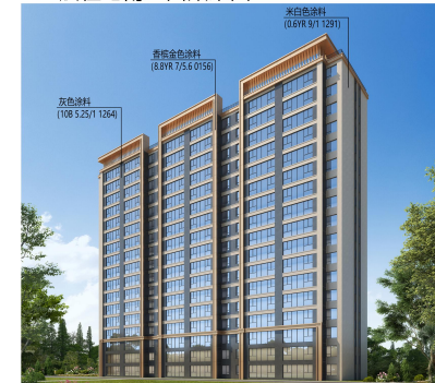
17层住宅南立面效果图