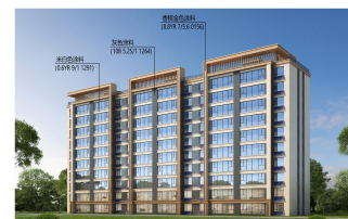
10层住宅南立面效果图