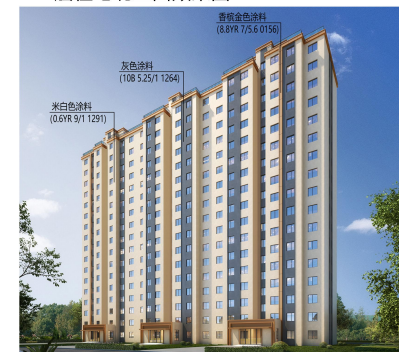
17层住宅北立面效果图